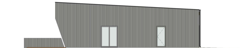
VAADE - LOODEST