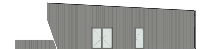
VAADE - LOODEST