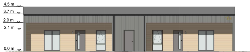
VAADE - EDELAST