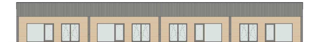
VAADE - KIRDEST