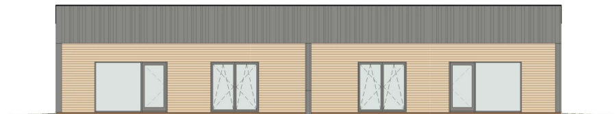
VAADE - KIRDEST