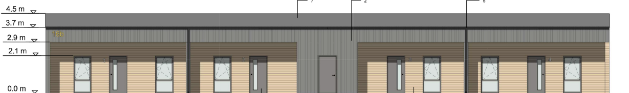
VAADE - EDELAST